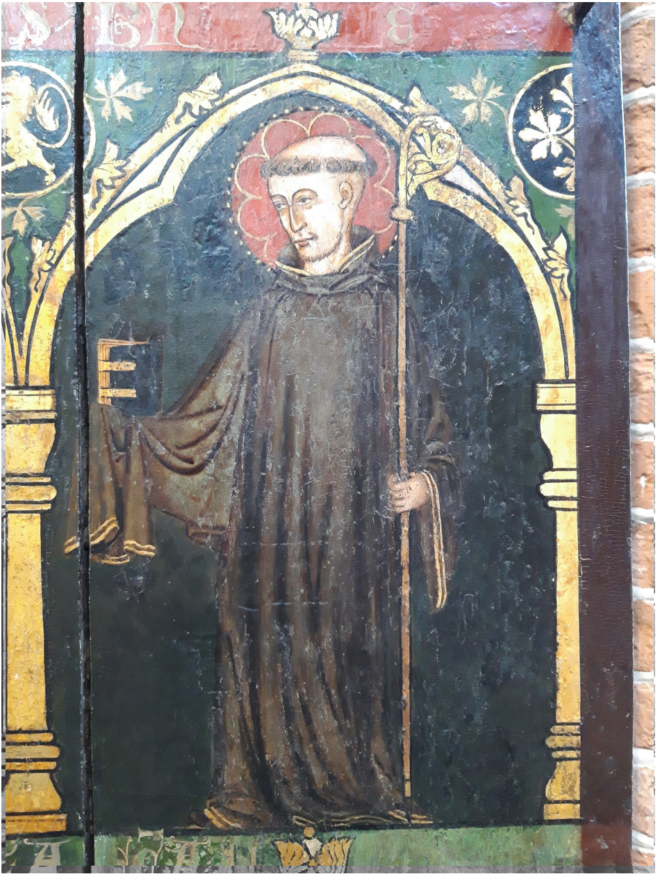
Maleri af St. Benedikt fra relikvieskabet i Løgumkloster, ca. 1300. St. Benedikt er afbilledet med sin klosterregel.