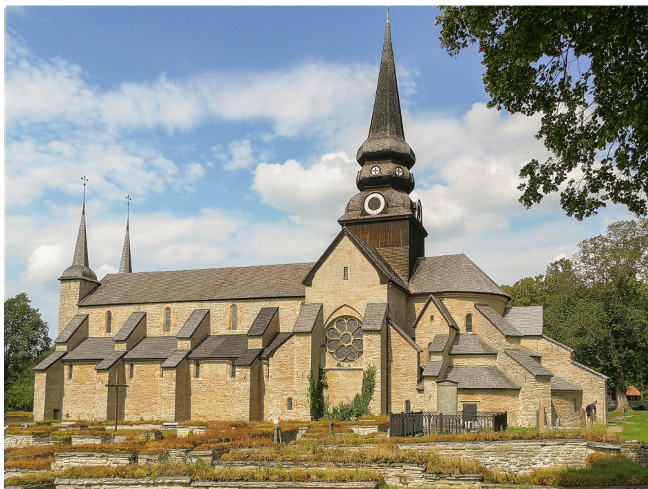
Varnhem klosterkirke set fra syd.