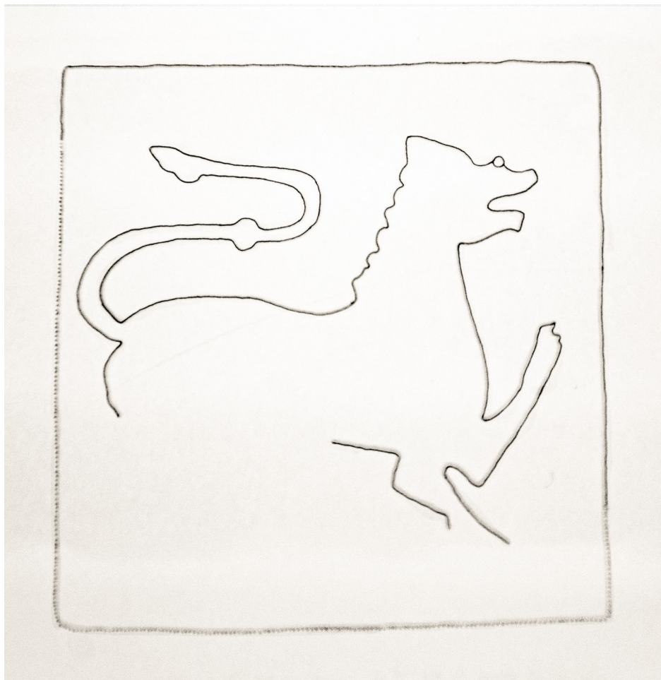
Tegning af teglstensflisen fra Øm Kloster. Efter Birgit Als Hansen og Morten Aaman Sørensen 2005. Ornamenterede middelalderlige gulvfliser i Danmark. København.

Indtil for omkring 10.000 år siden, var løven det mest udbredte landpattedyr efter mennesket. Den kunne findes i størstedelen af Afrika, igennem hele Eurasien fra det vestlige Europa til Indien, og i Amerika fra Yukon til Peru.