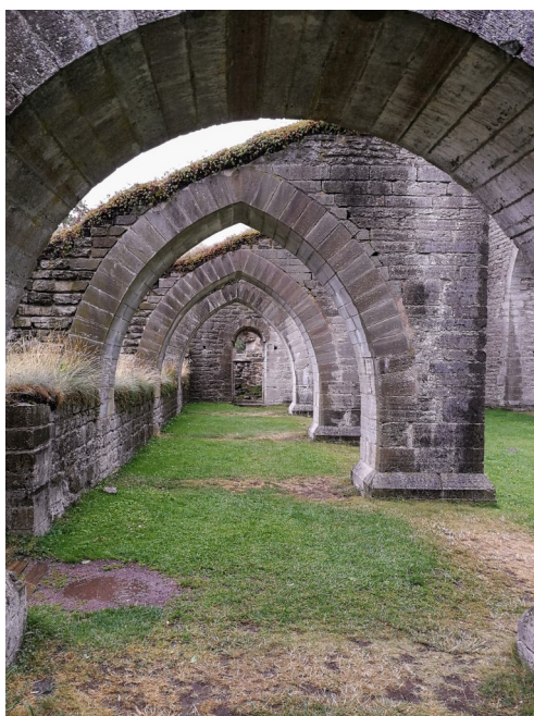
Ruinen af Alvastra kirke. Her det søndre skib.