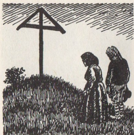
Hellig Anders Kors ved Knudbro

Bogen udgives på Turbine Forlaget i maj 2020.