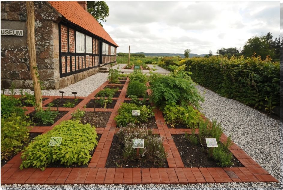
Øm Klosters have som den ser ud i dag.