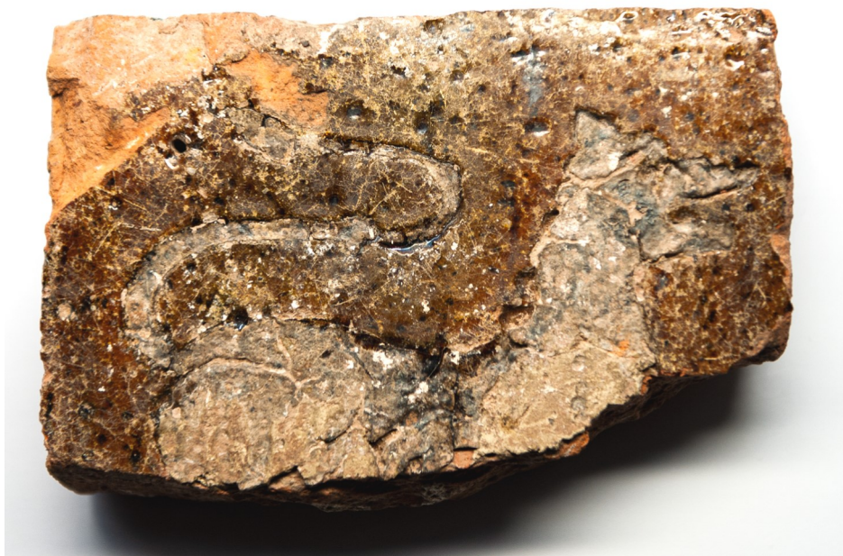
Teglstensflise med løvemotiv fra 1300-årene fra Øm Kloster. Fundet ved udgravninger af klostrets vestfløj i 1978.

Det er umuligt at svare entydigt på, hvad mesteren bag teglstensflisen, lægbrødrene og munkene har forbundet med løvefiguren, men i det følgende