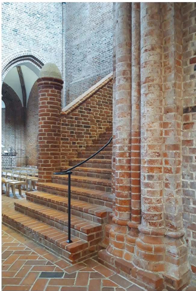
Arkitekturen i et cistercienserkloster. Nattrappen i Løgumkloster.

Her er vore kilder problematiske, fordi de antyder, at dette klostereksperiment var ved at uddø, på grund af personalemangel. Denne påstand kan imidlertid være et resultat af det faktum, at ankomsten af Bernard og hans venner til klostret Clairvaux i 1112 blev en saltvandsindsprøjtning for Det Ny Kloster. Det ser ud som om Stefan, allerede før Bernards ankomst, var ved at forberede grundlæggelsen af det første datterkloster fra Det Ny Kloster. Her ved omtalen af et datterkloster er det nødvendigt at præsentere det dokument, Abbed Stefan forfattede, og som gør ham til cistercienserordenens grundlægger.