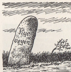
Tre Rye-veje fra Århus

Storring til Høver. I Hasle stod en sten, hvor der med gammeldags bogstaver stod RYE VEYEN. Fra Høver gik ruten over Nr. Vissing, Jaungyde langs enden af Knudsø, hvor den krydsede Skanderborg Viborgvejen og videre langs sydsiden af Knudsø til Ry Mølle, hvor Gudenåen passerede. I den ældste tid er vejen gået op over Siim og har passeret Ry Mølle sø ved snævringen. Fra Gl. Rye, engang købstad, er vejen gået ad den nu så kendte turiststrækning langs foden af Højkolbakkerne til Salten og herfra over Them, Asklev, Sebstrup til Hjælland, hvor en vejgren fra Horsens stødte til. Videre vestpå gik den