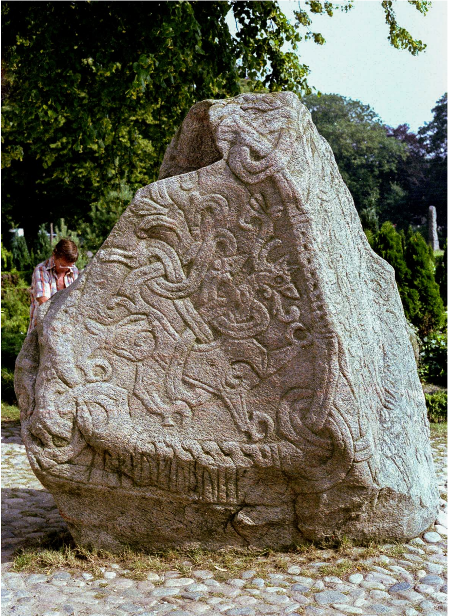
Den store løve på Jellingestenen. Efter Wikimedia Common.

I et skrift med titlen: "At det er umuligt for en synder at skjule sig" , citerer han 1. Peters Brev, om den brølende løve der truer og opfordrer til at søge tilflugt i Guds ord, der er som et skjold.