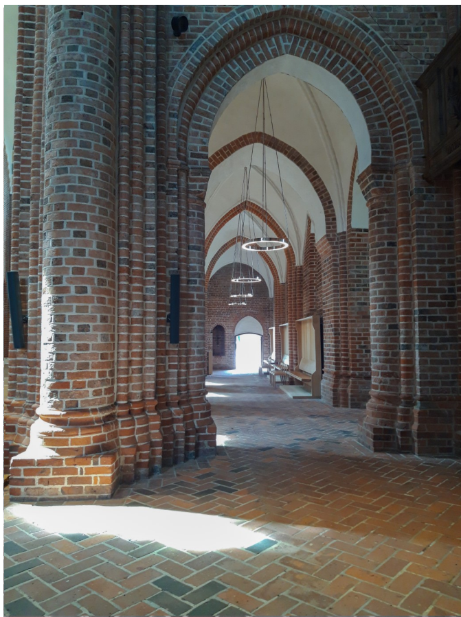
Arkitekturen i et cistercienserkloster. Nordre sideskib i Løgumkloster.

sterciensserordenen var ikke demokratisk, idet kun abbederne deltog i dens styrelse, men der blev en stor grad af selvbestemmelse klostrene imellem.