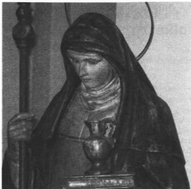
Den hellige Valborg. Figur i Konter kirke, Luxemburg.

Udover at beskytte barselskvinder, anråbes Valborg også ved øjenlidelser og hundegalskab. Sidstnævnte fordi det fortælles, at hun engang uanmeldt kom til en borg for at pleje husets syge datter, Ved porten for hundene mod hende, men hun stoppede dem med et enkelt blik – og helbredte samme nat det syge barn.