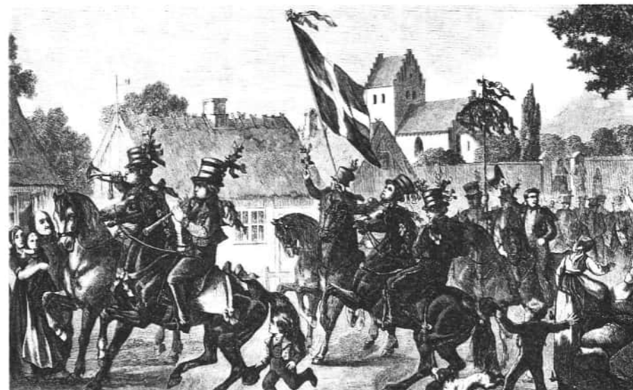
Der rides maj i by. Brøndegaard: Folk og Flora 1978-80, bd. 1.

Og der blev sunget majviser. De findes i adskillige former, som varierer fra landsdel til landsdel. Men viserne handlede alle om forventningerne til sommerens afgrøder og om held i fremtiden. Bl.a.: »Giv olden god, velsign vor skov. Giv flæsk på bord, dit navn til lov« eller »Bevar vor gæst for alskens nød,