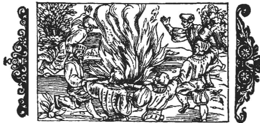
Ilden spillede en stor rolle i Valborgsfejringen. Olaus Magnus 1555.

Valborgsaften var tæt forbundet med majfesten dagen efter, og var vågenat, hvor der skulle bindes blomsterkrans til næste dags kroning af majgreven og hans følge, og altså også rejses majstang. Endvidere tændtes bål og blus for at holde hekse og andet troldtøj på afstand, og hvis ilden ikke var nok, så skulle larmen fra horn og klokker nok holde onskaben væk. En tradition Valborgsaften var at springe gennem bålet. Ilden ansås for at være både rensende, helbredende og beskyttende.