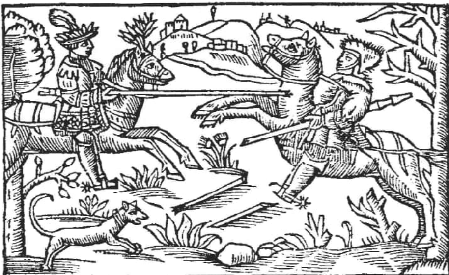
Kampen mellem vår og vinter. Olaus Magnus 1555.

Af andre festligheder på majdag skal nævnes »Kampen mellem vinter og vår«, hvilket var en kamp mellem to ryttere, der symboliserede de to årstider. Kampen skulle selvfølgelig vindes af våren, iklædt grønne kviste og blomster. Hvorvidt dette har fundet sted i stor udstrækning i Danmark vides ikke, men i Sverige findes flere beretninger om dette fænomen.