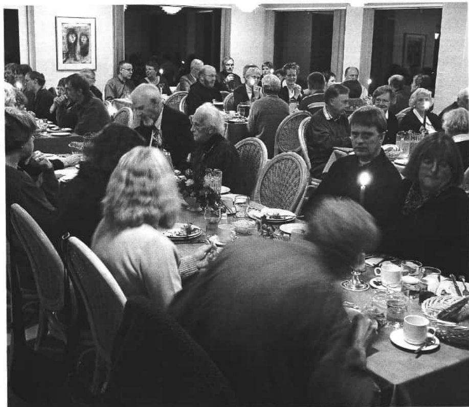
Over 70 medlemmer var samlet på dagen.