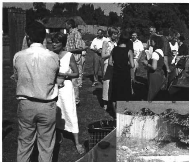
Mange var mødt op til reception den 8. august ved udgivelsen af bogen om Øm Klosters historie