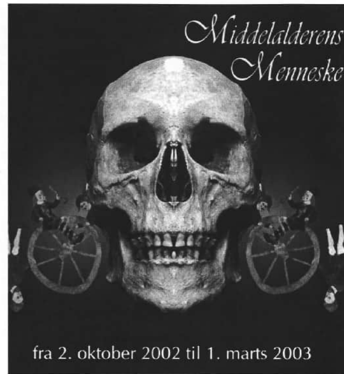
Plakaten til- særudstillingen »Middelalderens Mennesker»