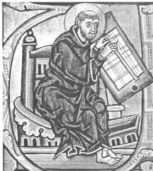
En munk i færd med at opstregge en bogside med lineal og skrivebly.