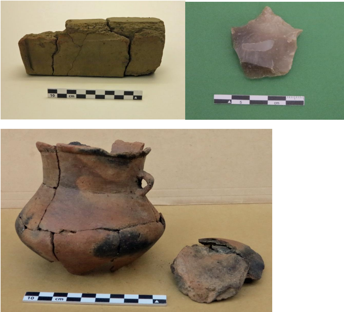
Figur 13; Øverst til venstre: Næsten hel ildbuk fundet i en førromersk grube. Øverst til højre: Lille flintbor fundet i en grube i det midsulehuset. Nederst: Lille hankekar, næsten helt. Karret er fundet i en førromersk grube. Øret er så smalt at den måske nærmere har været brugt til ophængning end til at holde fast i.