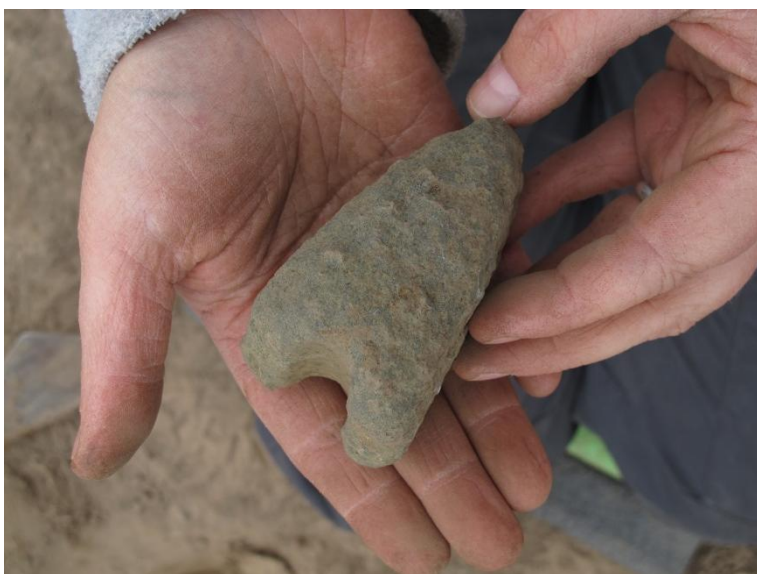
Figur 8; Den halve stridsøkse.

Øksen har et meget fint gennemboret hul og øksen har været sleben. Dog er stenarten af en slags som forvitrer nemt, så øksen fremstår meget ru, men har sikkert haft et meget glattere udseende da den var nyligt fremstillet. Enkeltgravskulturen blev førhen kaldet stridsøksekulturen, netop på grund af deres glæde for stridsøkser. Stridsøksen var ligeså meget et prestigesymbol som det var et våben. Denne halve økse er sandsynligvis kasseret efter den gik itu. Måske blev den siden fundet af en jernalderbonde, hvorefter den havnede i en affaldsgrube.