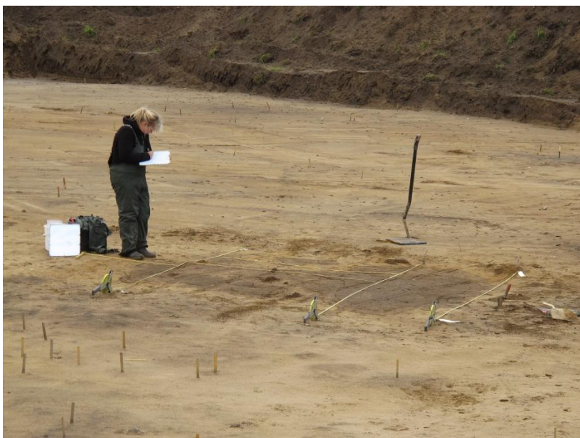
Figur 5; Her tegnes der i et lokalt målesystem.

Der blev anvendt en tørsold på stedet, hvor bundlag i grave og husforsænkninger på soldet. Da jorden primært bestod af sand, var dette et forholdsvist nemt foretagende.