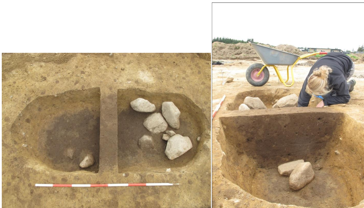
Figur 10; To fotos fra den mulige jernaldergrav. Til venstre ses fladen ca. 30cm nede og til højre ses Nanna i færd med at rense op til foto.

Omkring huset, særligt mod nord og vest ses en hel del gruber som kan dateres til enten ældre førromersk jernalder eller førromersk jernalder. Enkelte af disse havde karakter af jordfæstegrave. Langt hen ad vejen troede vi at der var tale om grave. Anlæggene lå Ø-V-orienteret, som de normalvis gør i jernalderen, var rektangulære eller langovale og målte 2,5-3m i længden og ca. 1m. i bredden. Under udgravningen af det ene anlæg, A17074, er der endnu tvivl om, hvorvidt anlægget var en grav eller blot en nedgravning. Anlægget havde forholdsvis lige sider og plan bund. Desuden var der kastet en del større sten ned i den vestlige del, hvoraf flere var kværnsten. Der blev dog hverken fundet gravgaver eller kistespor som kunne bekræfte at der var tale om en grav, men muligheden for en tom grav foreligger stadig.