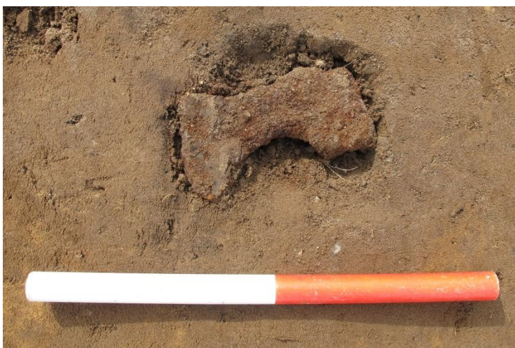
Figur 11; Jernøkse fundet i en grav.

Gravene må således ligge langt fra bebyggelse, og dermed også helligt område. Kan der være tale om to fredløse som er stedt til hvile langt fra hjemmet? Dette ville forklare enkeltheden i gravenes opbygning.