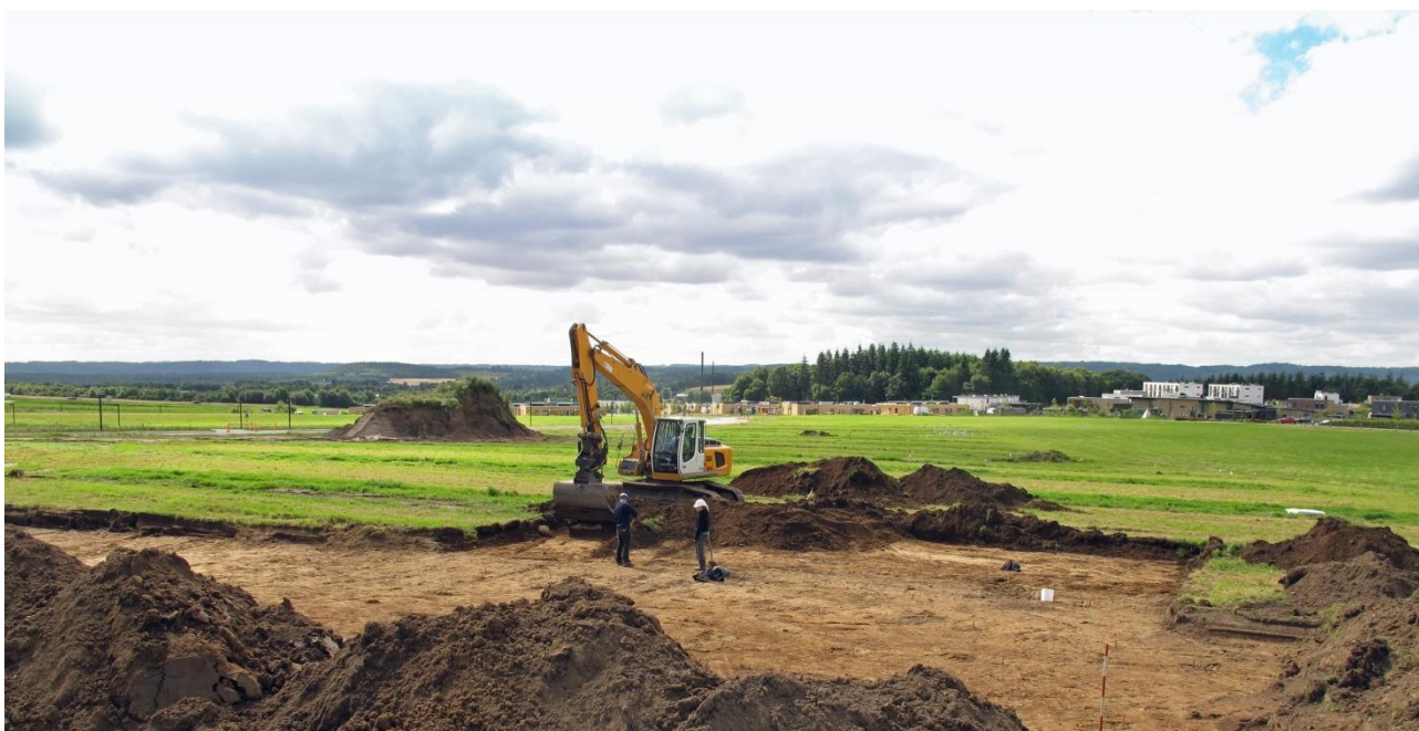
Figur 2; Arbejdsfotos fra udgravningen.