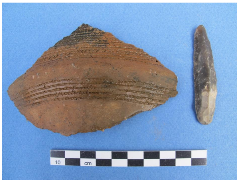
Figur 7; De to gravgaver: Et fint ornamenteret bugskår samt en flot forarbejdet ildsten.

Graven der er fundet i Kildebjerg på denne udgravningskampagne er ganske særlig. Graven er oval i fladen, måler 128X77cm og har en ØNØ-VSV lig orientering. Graven havde en helt plan bund og var kun 15cm dyb. I fylden lå der en del sten mellem 10 og 40cm i diameter samt enkelte flintafslag og små stykker keramik. På bunden lå der en gravgave i hver sin ende af graven. Mod ØNØ havde man placeret et muligvis bearbejdet stykke bugskår. Bugskåret havde form som et harlekintern med et kraftigt bugknæk i midten. Da lerkar i stenalderen er formet ved hjælp af pølseteknik, vil det være en usædvanlig måde at knække på, derfor mener undertegnet at skåret må være slået til denne særlige form. Skåret kan på denne måde have fungeret som et lille symbolsk bæger, hvor der nemt kunne ligge væske i. Det er derfor meget muligt at dette bugskår skulle symbolisere et større bæger eller man har ment at et mindre "bæger" ville passe bedre til eks. et lille barn.