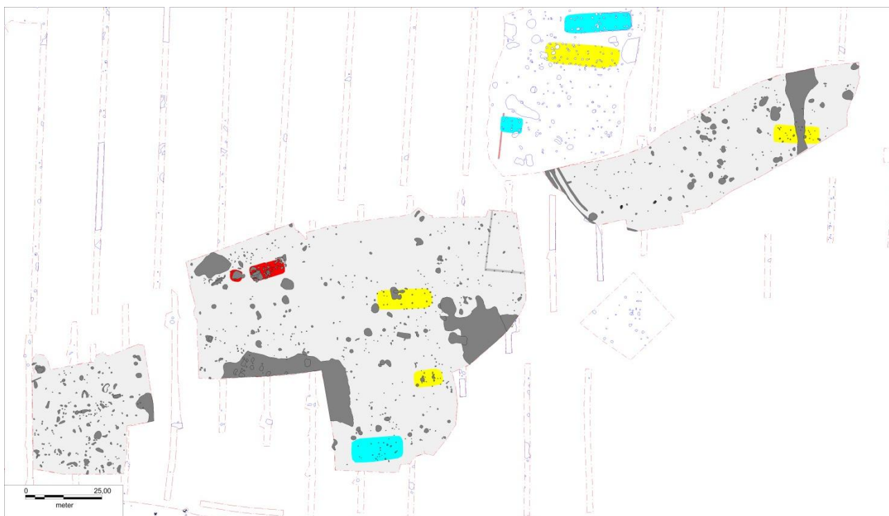
Figur 6; Digitaliseret plan over udgravningsfelterne. Der er de grå felter som tilhører denne udgravningskampagne, øvrige er fra tidligere kampagner.

På lokaliteten er der fundet i alt 1054 anlæg. Heraf er der 248 stolpehuller, 5 steder med kulturlag, 4 brønde, 3 grave, 137 gruber, 7 ildsteder, 14 stenspor, 5 ikke tolkbare og øvrige er enten naturfænomener, fyldskifter eller udgår af anden årsag. Der blev i alt fundet 6 konstruktioner. I det følgende vil resultaterne blive listet efter kronologi med det ældste først.