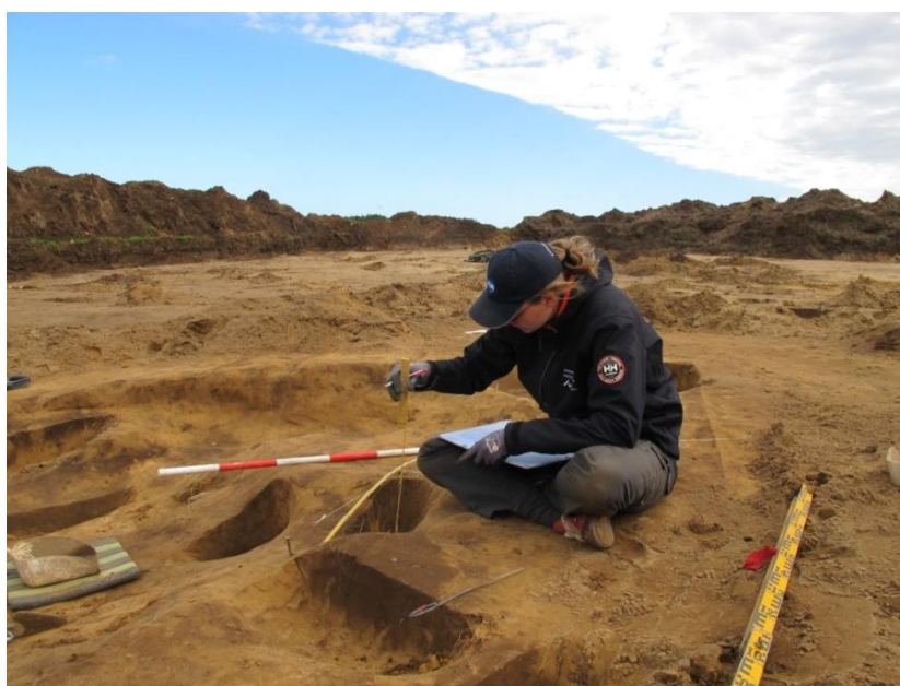
Figur 1; Arbejdsfoto fra udgravningen.