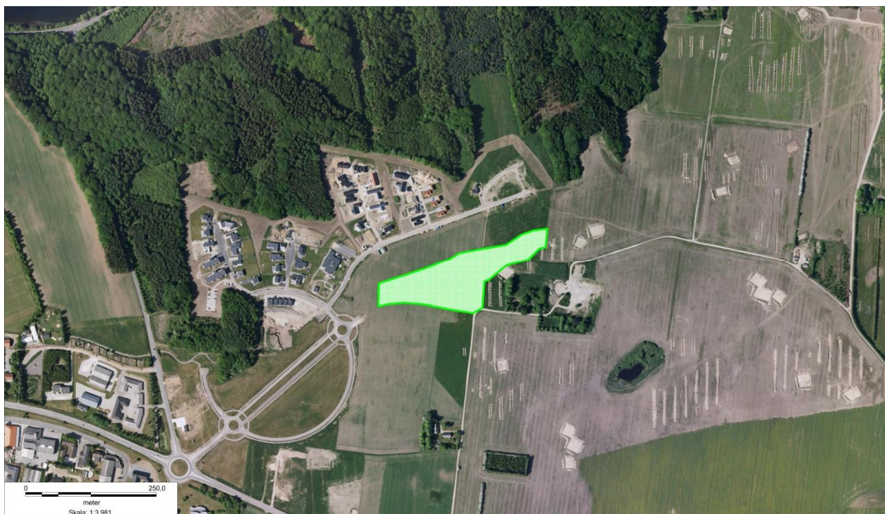
Figur 12; Hele det grønne areal er nu frigivet.