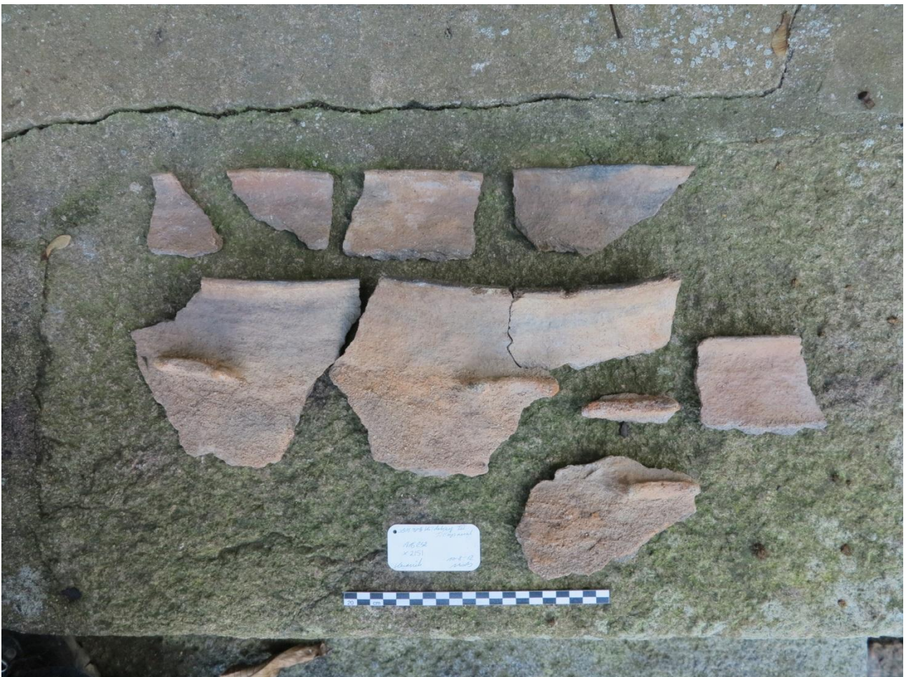
Figur 9; Større dele af et forrådskar fra yngre bronzealder P. IV eller V.

Der er flere gruber i området der rummer en hel del keramik, som er meget tidstypisk for yngre bronzealder. Noget kan endda specifikt knyttes til periode IV og V (1100-700 f.Kr.)