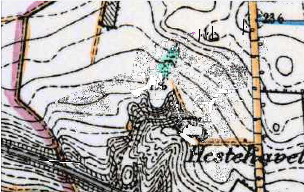
Figur 5, Maalebordskort med udgravningerne indtegnet

Generelt var muldtykkelsen mellem 40 og 70 cm.