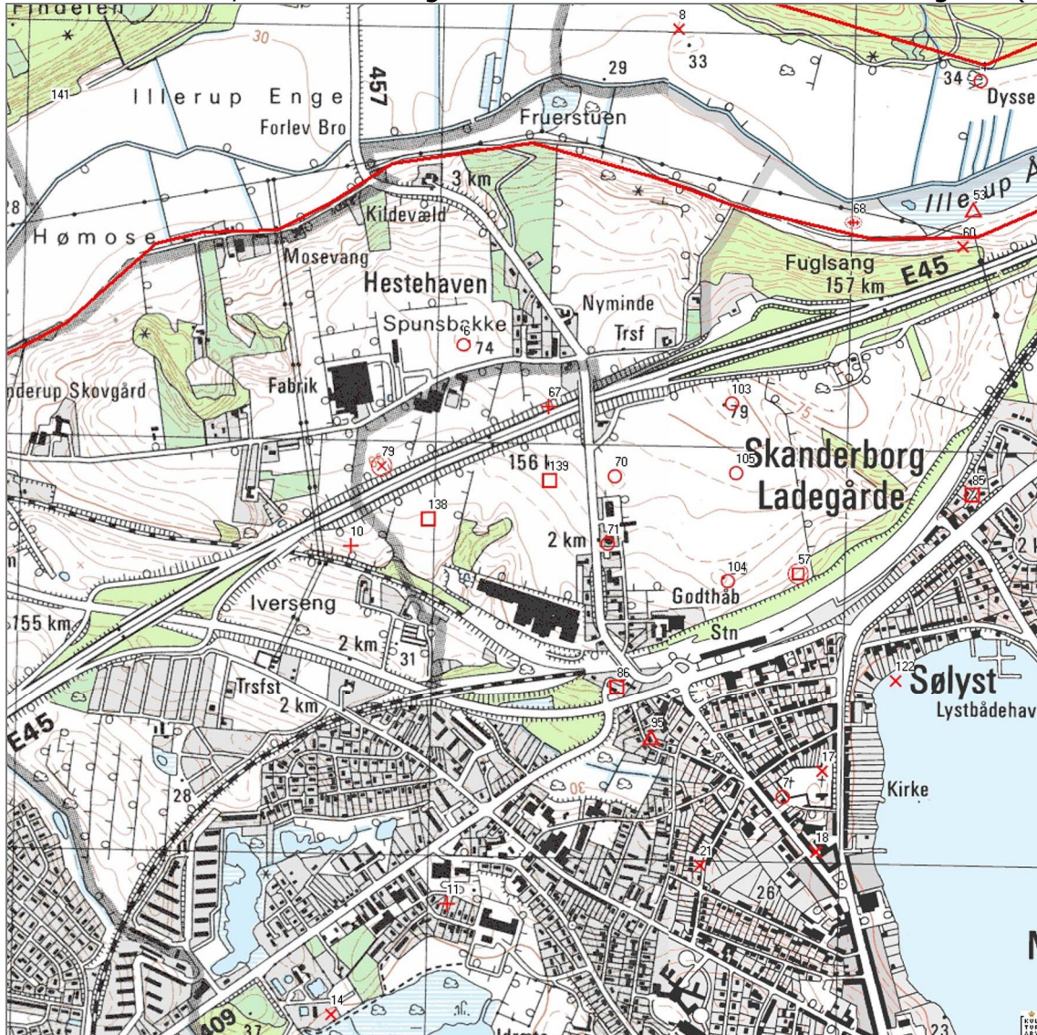
Figur 3. Kortudsnit fra DKC med fundmarkeringer

Som det allerede er gennemgået i rapporten for Etape III byder området omkring udgravningen, SBM 949 Godthåb på flere interessante fundkategorier. Et kortudsnit herunder viser de fund, som findes registreret i Det kulturhistoriske Centralregister (DKC).