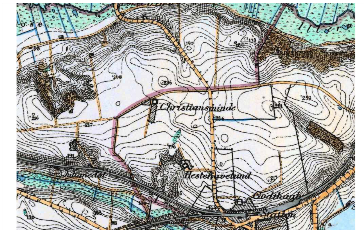
Figur 4. Maalebordskort 1867-1879

Det undersøgte areal er beliggende umiddelbart syd for motorvej E45 på et areal, der skræner ned mod banelegemet, der gennemløber Skanderborg by. Der er flere højdedrag i området og bebyggelsen har været beliggende på en stor bakkeø, der mod nord er afgrænset af Illerup Ådal, mod sydøst af Skanderborg Sø og mod sydvest af Iverseng. Landskabet er herved udformet som en typisk østjysk istidsbakkeknold eller moræneknold. På knoldens øverste og nordøstligste områder er der registreret flere overpløjede gravhøje. Længst mod nord falder terrænet kraftigt ned mod Illerup Ådal, mens det mod syd falder mere jævnt. Området har i oldtiden været mere præget af vådområder, som kunne påvises enkelte steder under udgravningen. Et ret markant forløb af et vådområde/slugt kunne påvises i et nordøst-sydvestgående strøg umiddelbart sydøst for udgravningen. Slugten fremstod nu som mere eller mindre opfyldt, men da målebordskortet blev fremstillet i 1867-1879 har den stadig været synlig i terrænet, idet den er medtegnet på dette kort.