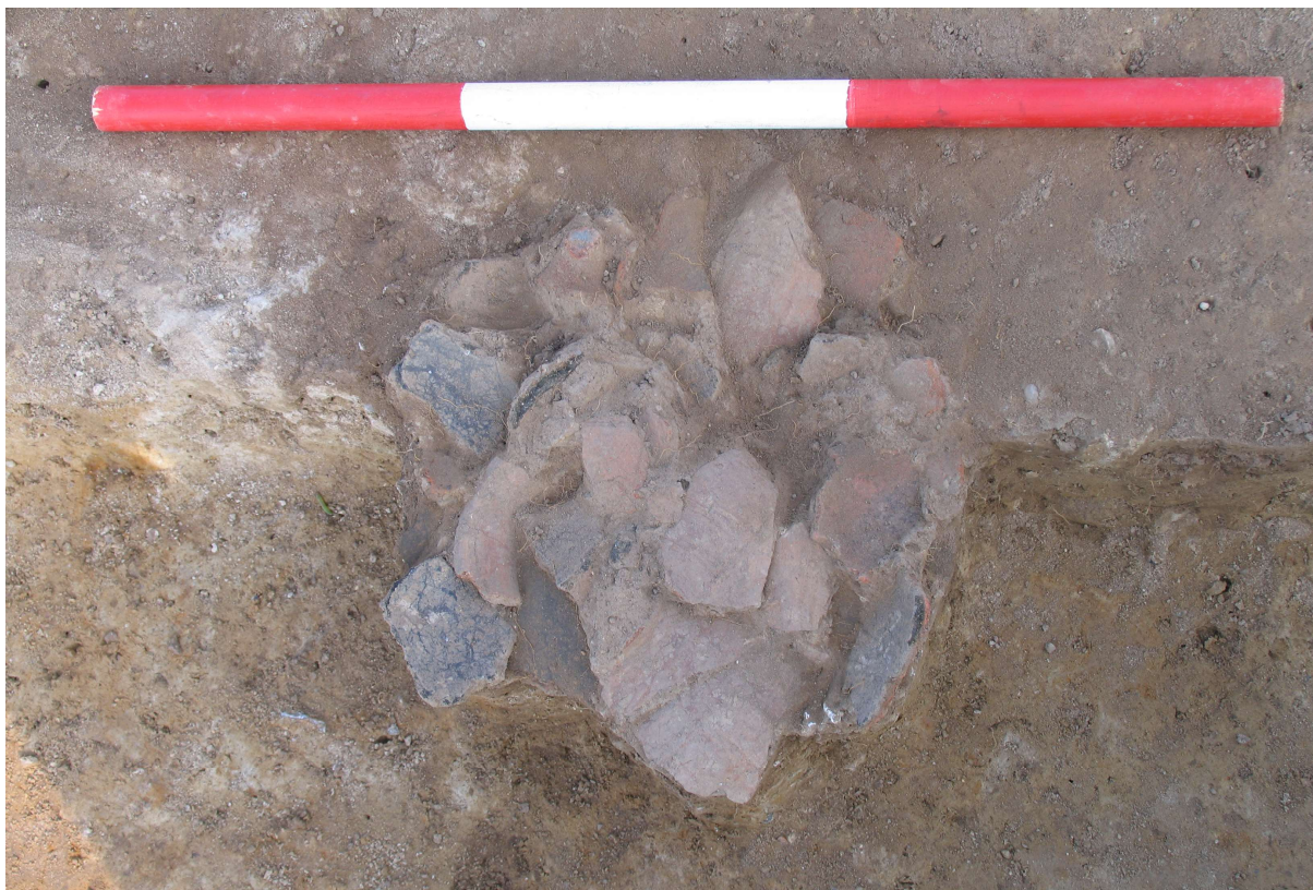
A 1 set fra nord med lerkarskår fra x 1 og 2 og spredte brændte knogler.