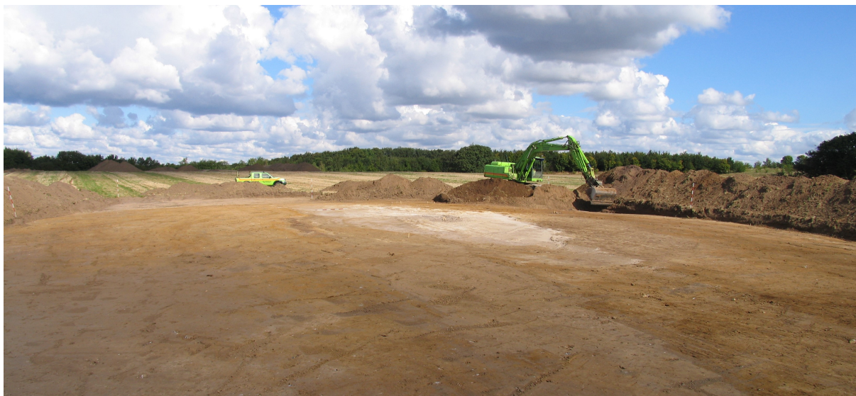
SBM 1015, Godthåb V muldafrømmes

De arkæologiske undersøgelser er foretaget på matr.nr. 10a, Hestehaven, Skanderborg Jorder, Skanderup sogn, Skanderborg amt for byherre: Sjælsøgruppen A/S Undersøgelse af gravhøjstomter samt forundersøgelse af et mindre areal