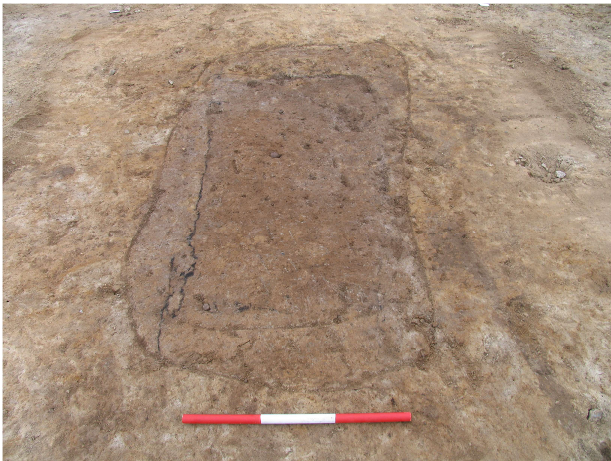
Graven A1 set fra vest. Nedgravningen samt de forkullede kistespor ses tydeligt.