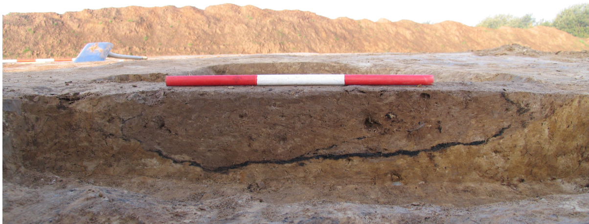
Grav A 1 med det østvendte profil med tydelige spor af de forkullede træplanker.