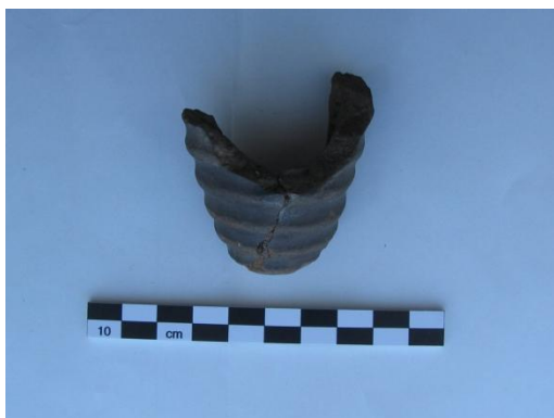
Figur 7; Fragment af drikkebæger, X1

Kun ca. 4m NV for graven fra ældre romertid er der fundet fragmenter af et meget sjældent drikkebæger. Drikkebægeret er en imitation af romertidens glasbægre. Bægeret er lavet af ler. Sådanne fund ses sjældent i Danmark og forekommer som regel kun i grave. Man formoder at bægrene blev lavet i ler fordi de ægte romerske glasbægre var svære at få fat på. Lerbægrene har således skulle repræsentere rigdom i en symbolsk forstand. Fundet skal dateres til yngre romertid og kan være resterne af en gravgave fra en jordfæstegrav eller brandgrav som er blevet forstyrret.