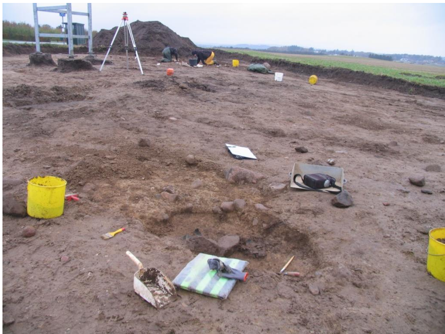
Figur 2; Arbejdsbillede. Romertidsgraven ligger foran i billedet. Set fra Ø.

tilknyttede højens brugstid blev nøjere undersøgt. Jordfæstegravene blev tegnet ind i hånden, nivelleret og fotograferet. Der blev udgravet med murske. Det nederste lag i graven som tilhørte gravlejet blev opsamlet i spande til senere soldning. Genstande fra gravene blev taget op, et enkelt fund blev taget op i præparat.