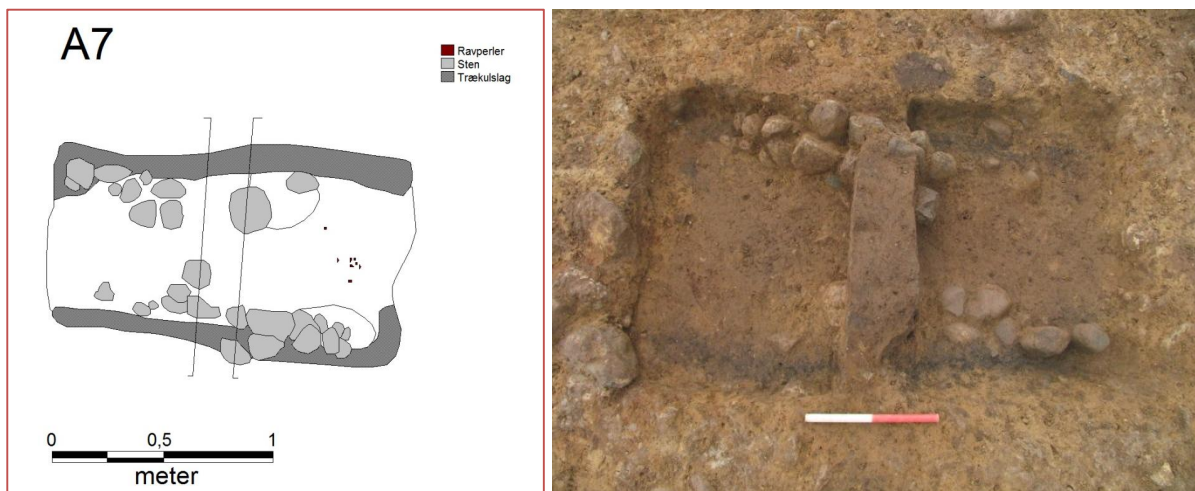
Figur 4; Digitaliseret plan over A7. Nord vender op. Til højre ses foto af det indtegnede. Her vender nord nedad.

del taler for at den gravlagte var en kvinde, idet kvinder altid blev gravlagt med hovedet mod øst og mænd med hovedet mod vest i Enkeltgravskulturen. Desuden findes ravperler næsten altid kun i kvindegrave i denne periode. Desværre var der ingen spor af den afdøde, men det kan ikke udelukkes at der i præparatet kan findes tandemalje.