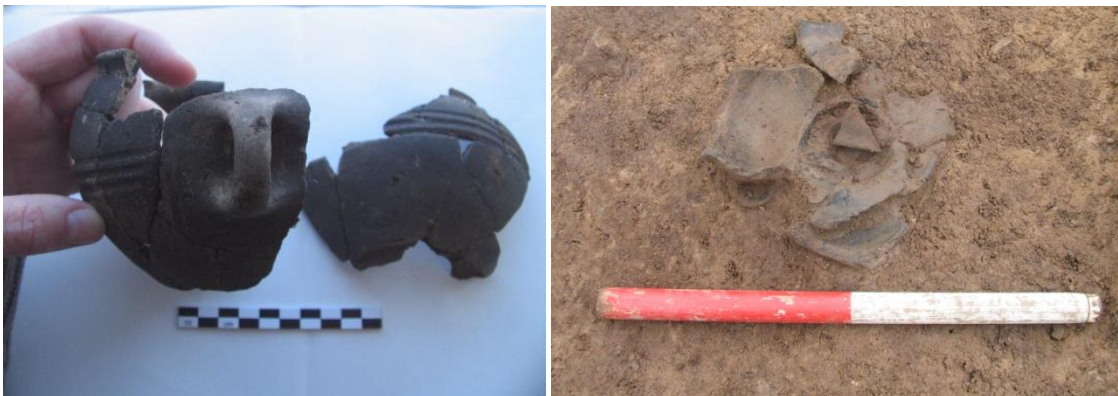
Figur 6; Til venstre: Den lille skål, X7. Til højre: in situ billede af X6 - se forside for at se karret i sin helhed.

To kar dukkede op i hver sin ende af graven. I den vestlige ende stod et lille hankekar og i den østlige ende stod en mindre skål.