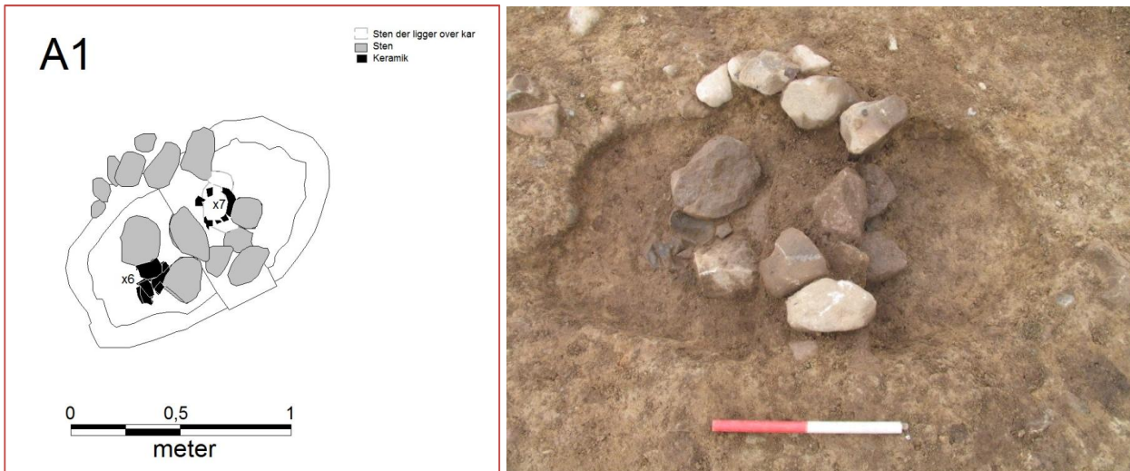
Figur 5: Digitaliseret plan af A1. X7 ligger under stenen, men er tegnet med på denne plan. Til højre: foto af samme tegning, her er kar X7 blot ikke synlig. Nord er opad.

På denne lokalitet ser graven således ud: