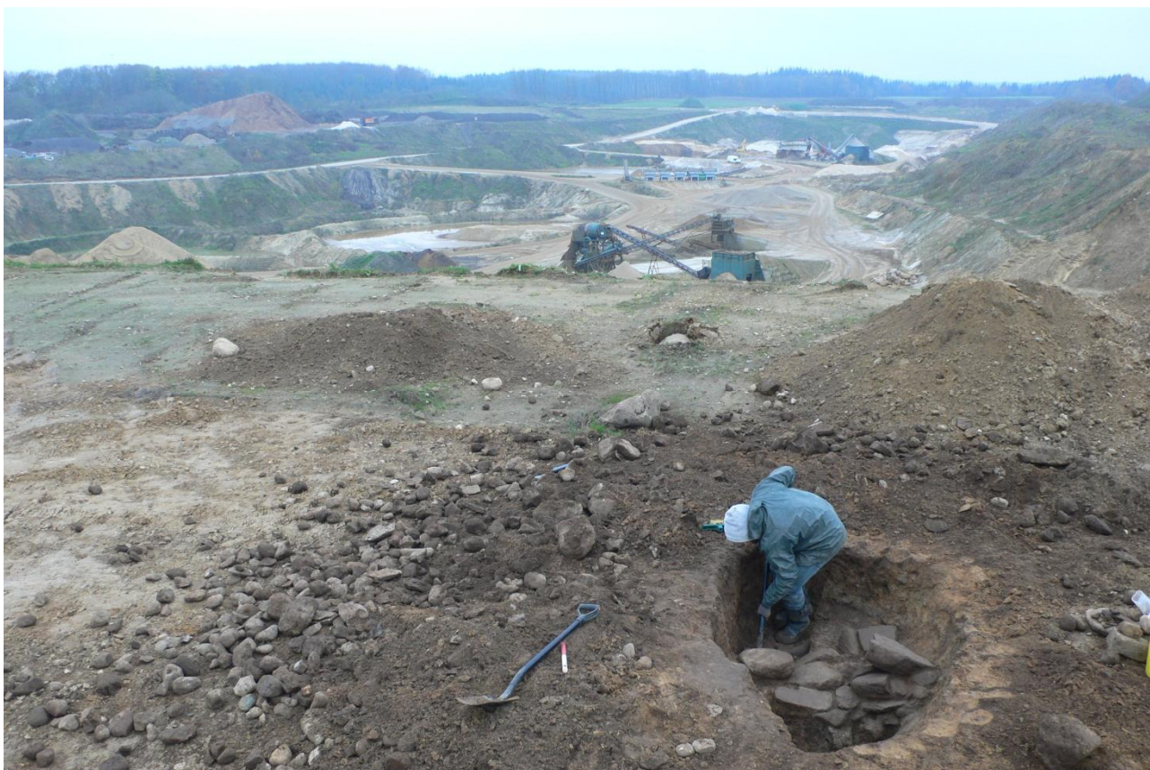
Figur 1; Vue over udgravningsfeltet og grusgraven. Set fra Ø.

Låsby sogn, Gjern herred, tidl. Skanderborg amt. Sted nr. 16.01.06. Sb.nr. 21.