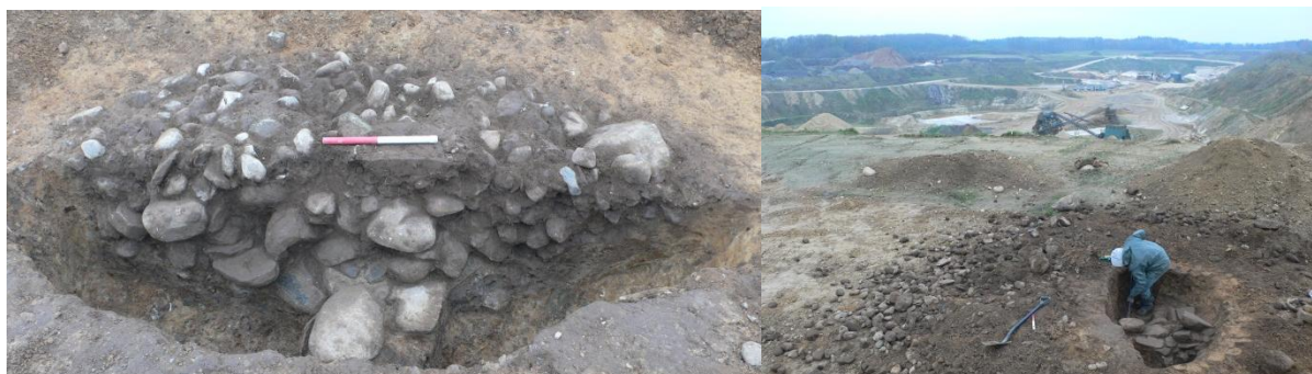
Figur 4; Til venstre profilen af A69, den stenfyldte "kværnstensgrube". Set fra S. Til højre er Kåre i gang med tømning af gruben. Set fra Ø.

En anden grube, A69, skiller sig ud fra mængden. Denne er oval i fladen, 2,5x1,7m og 0,7m dyb. Tilnærmelsesvis fladbundet og med et lyst gråt fyld i det nederste stenfrie lag. I det øverste ca. 50cm tykke lag er der fyldt op med sten på sten, hvilket ikke levner meget plads til jorden. Det er i denne grube der er fundet 6 kværnsten og 5 knusesten. Funktionen er ukendt, men minder meget om en type anlæg der er fundet på den sydligere liggende udgravning SBM1219 Kalbylund I. Her er typen foreløbig kaldt "kværnstensgrube" efter den store mængde kværnsten der blev fundet i mange af dem. Det er lidt pudsigt at typen også findes andre steder i det lokale område. Der er taget en jordprøve fra det grå nederste lag til flotering i håb om at det kan fortælle om grubens funktion.