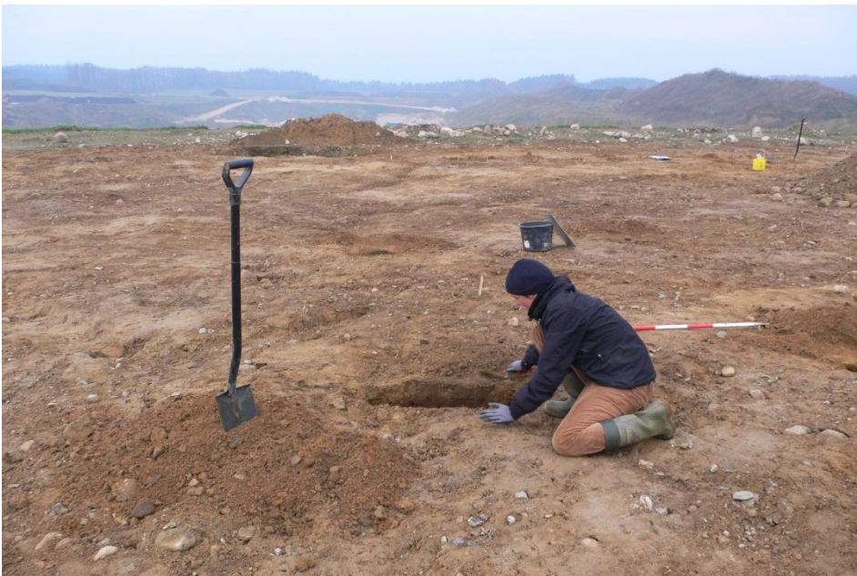
Figur 2; Louise er igang med afrensning af de tagbærende stolper i langhuset. Set fra Ø.

Ved udgravningen af de ca. 4000m 2 fremkom resterne af et gårdsanlæg fra yngre romertid med delvis bevaret indhegning. Gårdsanlægget er typologisk bestemt til yngre romertid. Derudover var der enkelte gruber fra den førromerske jernalder, heraf nogle med daterende keramik.