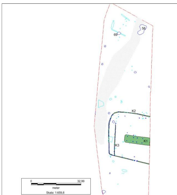
Figur 3; Oversigt over det udgravede område. De mørkeblå anlæg er gruber og stolper, mens de lyseblå er udgåede anlæg. Omtalte anlæg og Knr er noteret på tegningen. Den grå raster markeret et særligt gruset areal.

Ved udgravningen blev samtlige anlæg snittet, tegnet og registreret. Fund blev indsamlet. Et enkelt anlæg blev tømt. En af de større gruber blev snittet med maskine. Enkelte stolper, gruber, hegnforløb og hus blev ligeledes fotoregistreret.